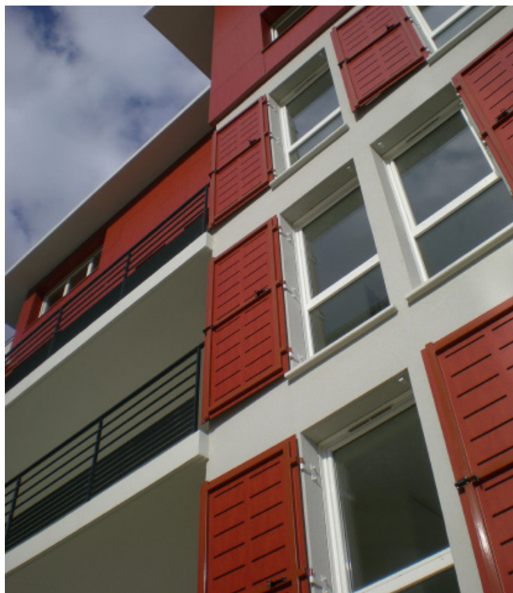
ARCHITECTE: RAFATDJOU MAKAN

LA MISE EN ŒUVRE DOIT ÊTRE CONFORME AUX AVIS TECHNIQUES PRODUITS/SYSTÈMES, A NOTRE BROCHURE D'INFORMATIONS TECHNIQUES EXTERIOR ET AUX RÉGLEMENTATIONS – NORMES – ARRÊTÉS – INSTRUCTIONS TECHNIQUES – CAHIERS TECHNIQUES CSTB EN VIGUEURS