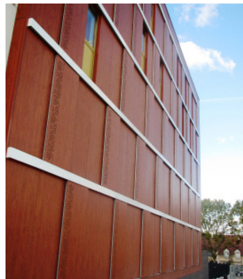
ARCHITECTE: BOSOME ET ONATE